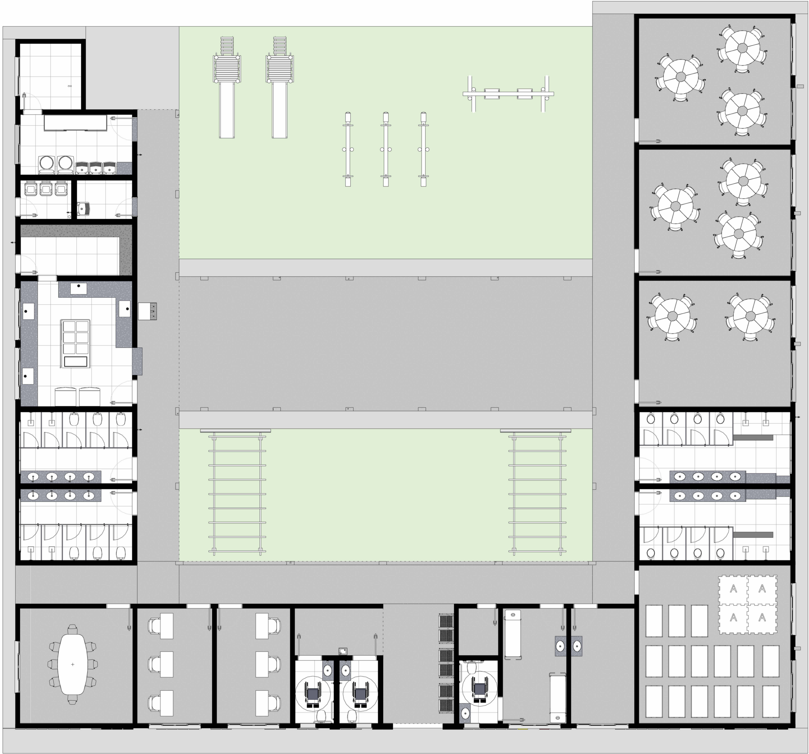
PLANTA LAYOUT ESC: 1 : 75